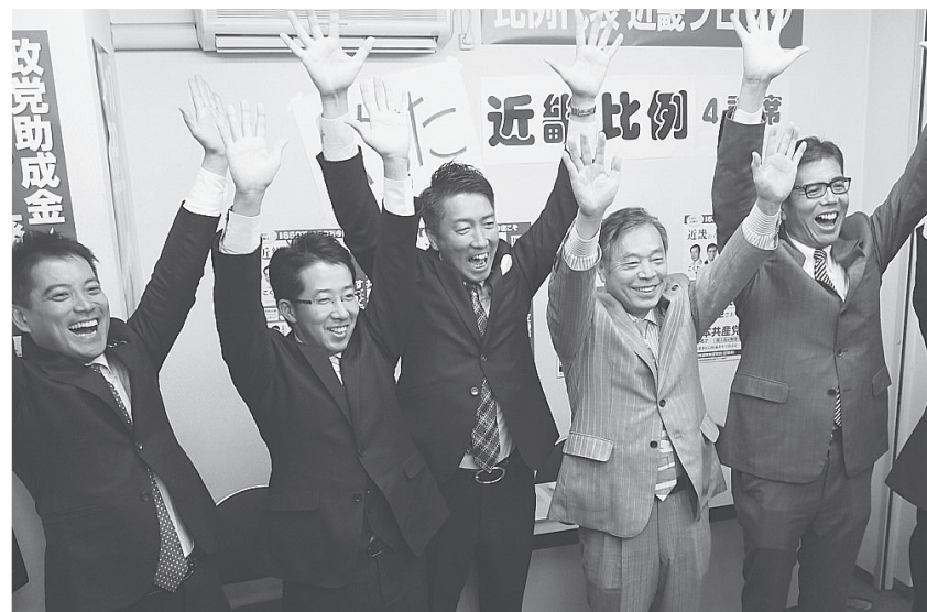
当選万歳をする(左2人目から)堀内、清水、こくた、宮本の各新衆院議員とたつみ参院議員(左端) 12月15日午前1時50分 大阪市中央区

12月14日に投・開票された総選挙の比例代表近畿ブロック(定数29)で、日本共産党は4議席を獲得。こくた恵二、宮本たけし、清水ただし、堀内照文の各氏が当選しました。