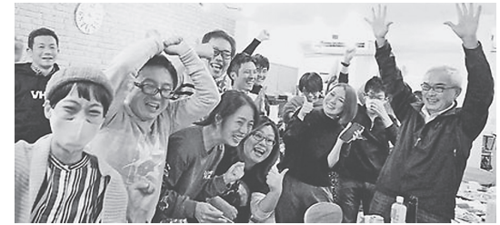
「反対」多数の報道に喜びを爆発させる市民 20年11月1日、大阪市