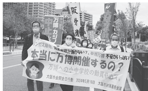
「万博への学校動員やめて」「万博もカジノも中止を」と行進する人たちは5月16日、大阪市北区

とれる団体休憩所は2000人分。日時もパピリオンも選べず開幕前は下見もできません。安全が守られず、教育効果も疑わしいものに動員することは許されません。