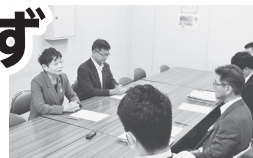
大阪府教委に「学校参加を強要するな」と申し入れる共産党大阪府議団。5月16日

とれる団体休憩所は2000人分。日時もパピリオンも選べず開幕前は下見もできません。安全が守られず、教育効果も疑わしいものに動員することは許されません。