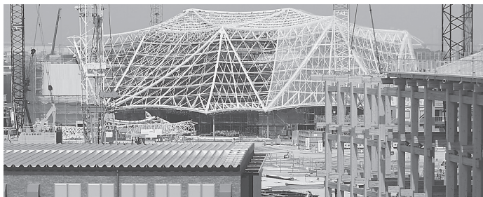
万博会場建設現場。大阪のパピリオン（奥）と「日よけリング」(右)=3月4日

万博協会は5月30日、大阪・関西万博の中心、パピリオン地区（夢洲2区・3区）で、3月に同1区で爆発火災事故が起きたと同じメタンガスが発生していたと発表しました。