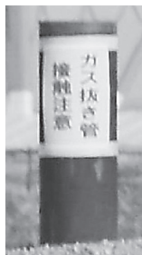
万博会場のガス抜き管