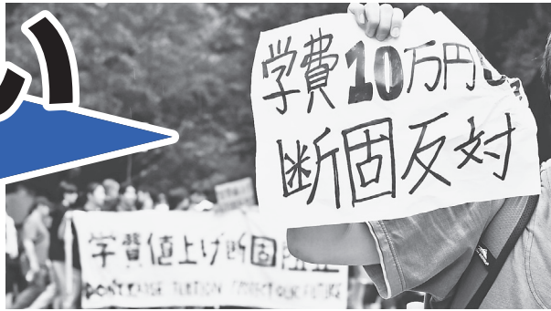
東大が学費値上げを検討している問題で、抗議する学生たち =5月19日、東大正門前

大学授業料を払うためアルバイトでヘトヘト、社会に出てからも奨学金返済に追われる。何がそうさせているのか？