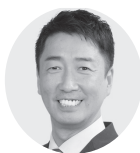
衆議院議員(期前) 清水 ただし (大阪4区連)