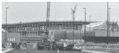
建設中の万博会場

「万博の華」と言われる海外参加国が自前で建設する「タイプA」のパビリオン。出展は当初の60カ国から47カ国へ約2割も減。当初予定では「今年7月には建築工事が完了」でしたが、8カ国はいまだに着工できていません。