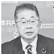
記者会見する小池晃書記局長=25日、国会内

ところが過去4回、決議に賛成してきた米国が、今回ロシア、北朝鮮などとともに反対に回りました。極めて重大です。