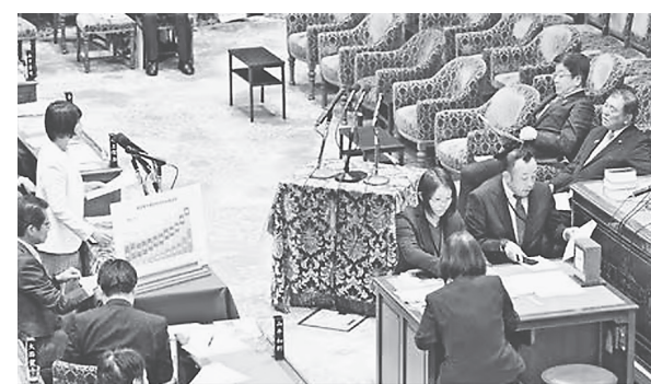
石破茂首相(右端)に質問する田村智子委員長=21日、衆院予算委

日本共産党の田村智子委員長は2月21日、衆院予算委で消費税が低所得者だけでなく中間所得層にも重い負担であると明らかにし、「5%減税に踏み出すべき」と提案。所得税・住民税の負担割合は年収に応じて累進性が認められるが、消費税を含めた税全体の負担率は年収800万円以下まで10