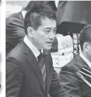
質問する辰巳孝太郎議員 =3日、衆院予算委

日本共産党の辰巳孝太郎議員は衆院予算委で3日、自民、公明、維新が医療費の最低4兆円削減で合意したことに関し、「医療崩壊が起こる」と指摘。2008年に出産間近の妊婦が7つの医療機関に受け入れを拒否され死亡した事件を例にあげ、「06年の1兆円の削減が現場の心を折り医療崩壊をもたらした」「1兆円で医療崩壊だ。4兆円の削減が一体どれだけの痛みをもたらすのか」と追及しました。